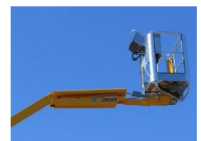
Fly jib (option)